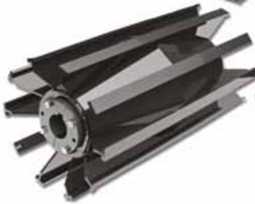
ROLOS PARA SERVIÇO STANDARD