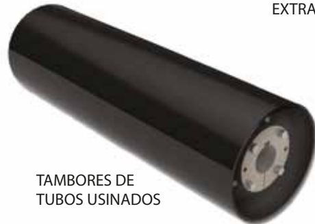
TAMBORES DE TUBOS USINADOS