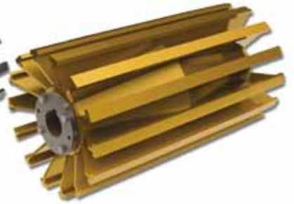
ROLOS PARA SERVIÇO EXTRA-PESADO COM RECOBRIMENTO R.A.*