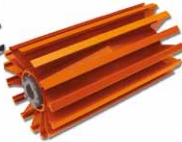
ROLOS PARA SERVIÇO MINERAÇÃO