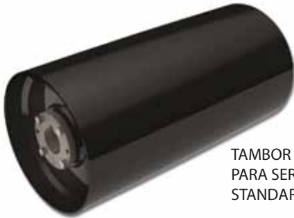
TAMBOR PARA SERVIÇO STANDARD