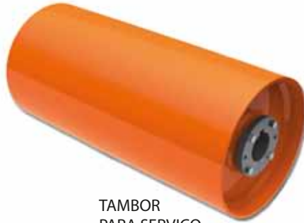
TAMBOR PARA SERVIÇO MINERAÇÃO