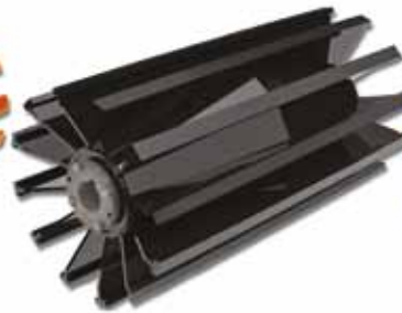
ROLOS PARA SERVIÇO EXTRA-PESADO