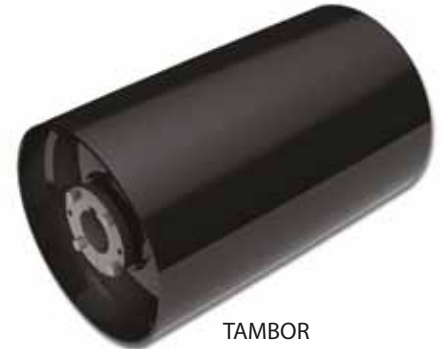
TAMBOR PARA SERVIÇO EXTRA-PESADO