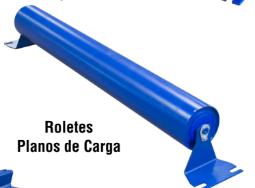
Roletes Planos de Carga