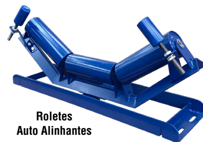
Roletes Auto Alinhantes