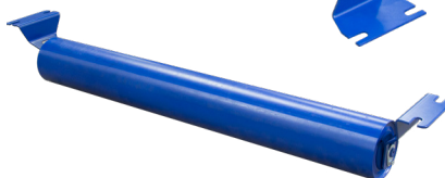
Roletes de Retorno em Aço