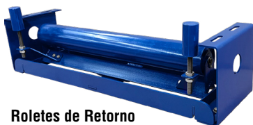
Roletes de Retorno Auto Alinhante