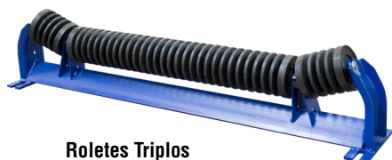
Roletes Triplos Desiguais de Impacto