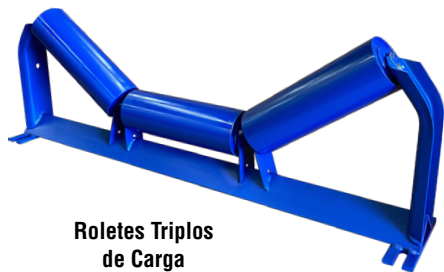
Roletes Triplos de Carga