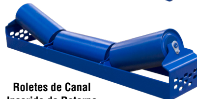
Roletes de Canal Inserido de Retorno